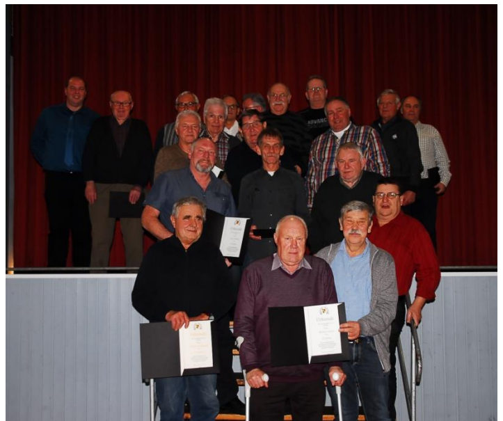
Alle geehrten Mitglieder

Für ihre lange Mitgliedschaft und die Treue zum Verein möchten wir uns nochmal aufs herzlichste bedanken. Im Anschluss folgte wieder ein abwechslungsreiches Programm mit Tombola, Schätzspiel und die Versteigerung des Weihnachtsbaumes. Zum Schluss ließ man die Feier gemütlich ausklingen.