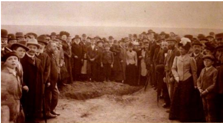
Ausgrabung auf dem Steinzeit - Hockergrabfeld von Flomborn am 3. April 1901.

Die Gemarkung Flomborns ist schon lange besiedelt. Bereits um 5000 vor unserer Zeitrechnung bestellten hier steinzeitliche Bauern ihre Äcker mit dem Steinpflug. Die Bauern waren aus dem unteren Donauegebiet eingewandert und brachten ihre Kultur in die Rheinebene. Hierzu gehörte die Sitte, die Toten in Hockerstellung zu bestatten.